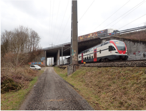
Die betroffene A1-Unterführung SBB Hardstrasse bei Hindelbank.

Die Arbeiten an der SBB-Unterführung unter der A1 bei Hindelbank verzögern sich um einige Wochen. Aufgrund neuer sicherheitstechnischen Vorschriften standen weniger Sperrnächte zur Verfügung, wodurch die Arbeiten länger dauern als geplant. Der Abschluss der Arbeiten ist nun auf Ende Februar 2023 vorgesehen.